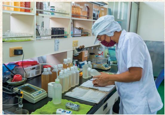
(左) 半自動化的工廠，員工人數不多，仍是兢兢業業，專注在各自的工作崗位上。(右) 做無香料、無化學添加物，還要能符合里仁嚴謹食品上架規範的天然飲品，任何一步都不能馬虎。