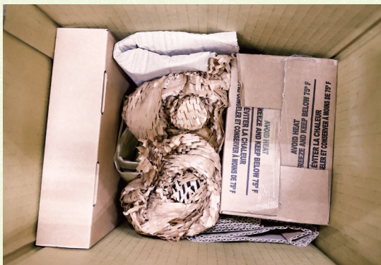
蜂巢紙可緊密貼合被包裝物，讓包裹空間更能有效利用。

然而更換包材並非一般人想像的容易，除了紙製品成本較高之外，物流人員的配合測試更是一大重點。曾醒超說：「拋棄式的氣泡袋