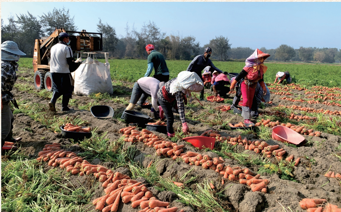
新鮮採收的紅蘿蔔迅速送到加工廠進行榨汁，才能保存最好的鮮度。

不腐壞及風味依舊，確實需要技術的突破。」所幸皇天不負有心人，最終在高溫滅菌技法與獨家祕方的搭配下，潤泉的飲品能在完全不需要依靠防腐劑、保質劑的狀態下，就能維持新鮮美味的口感。