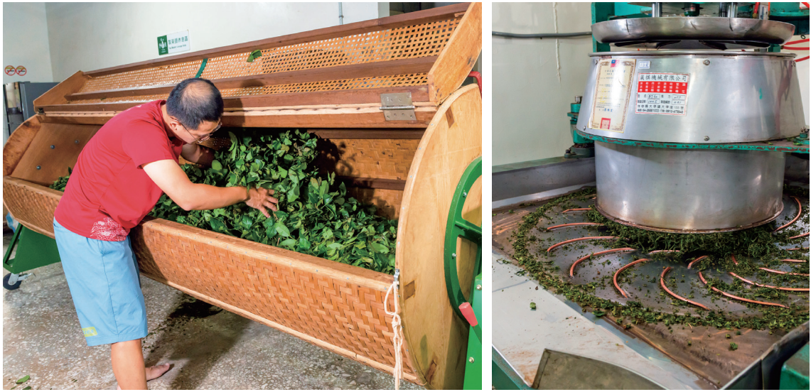
(左) 製茶需經過萎凋、浪菁、發酵、炒菁、揉捻等過程，非常依賴經驗和勞力。 (右) 揉捻是製茶的重要工序，藉此讓茶葉的細胞組織被擠壓並釋放茶汁。

為了陪伴茶農走過轉型陣痛期，慈心又提供肥料、資材等補貼。為協助茶農解決採茶期的缺工問題，慈心還從桃園、宜蘭等地組成達60人的龐大採茶阿嬤團，創造當地多年不見的採茶盛況。淨源茶場資深員工侯又升說：「剛開始大家都在看笑話，看我們能撐多久。漸漸地茶農知道我們是玩真的。」