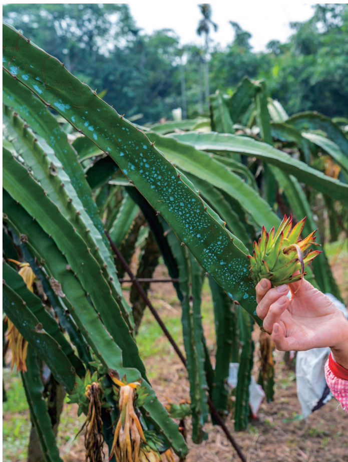
(上) 火龍果套袋後，方能阻絕多數病蟲害。