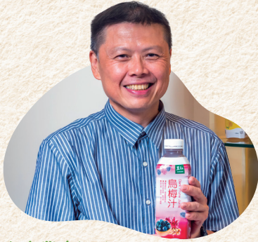
潤泉國際企業有限公司