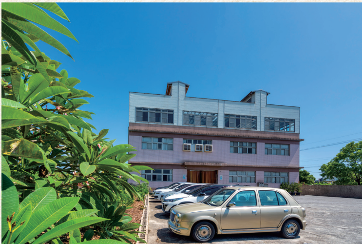
位於宜蘭鄉間田野裡的潤泉，廠房儘管不大卻也五臟俱全。

在製作過程中，為了徹底摒除防腐劑、增稠劑、色素、香料等化學成分，又要保留食材的溫潤口感，在製程上可說費盡心思。「當時潤泉仍以外銷為主，要如何把調味中可以拿掉的東西去除，又同時兼顧飲品的品質、確保在歷時較長的海運過程中