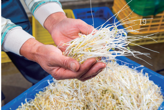
以有機方式栽種出的芽菜，全株皆可食，□□充滿營養跟生機。

頭，他先是開設生機飲食店，接著乾脆自行栽種芽菜。1999年他於桃園大溪新峰里搭建了第一間芽菜廠房；2015年後搬到現址，20年來持續精進栽種的流程與技巧。