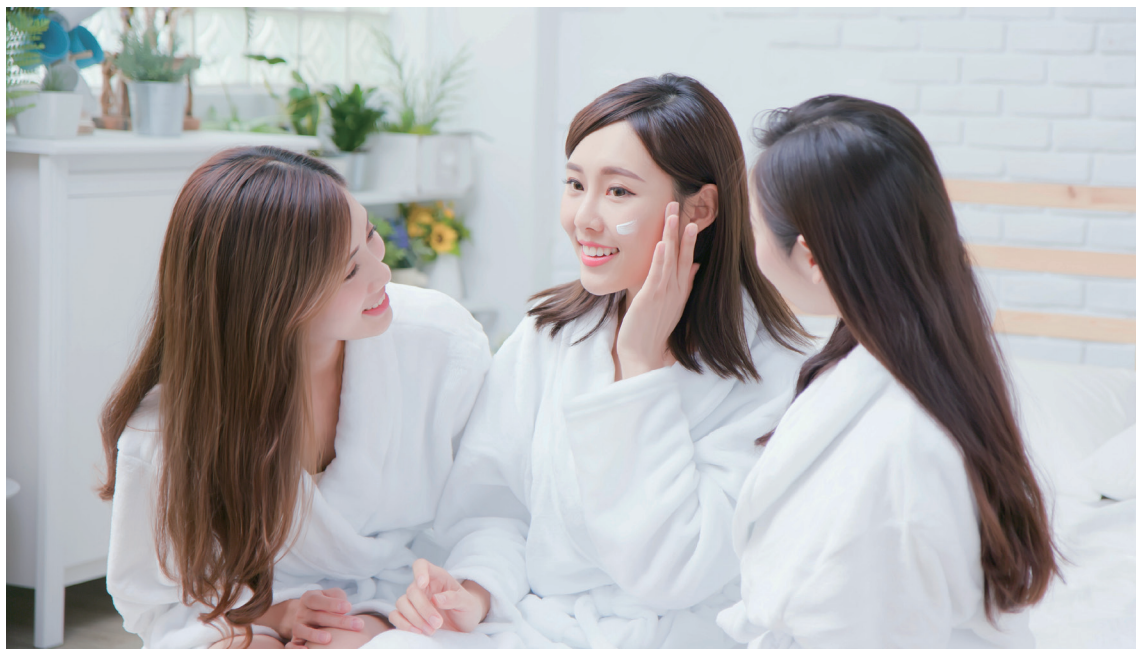
里仁在開發保養美妝產品的核心訴求，看重原料成分能對使用者和環境都健康、安全。

「永續議題是複雜的，開發任何新品都是一個學習的過程。」有多複雜？她舉 La Vie Naturelle 的玫瑰滋養霜為例，因配方含多種植物萃取成分，主打輕熟齡與熟齡肌，十分貼近