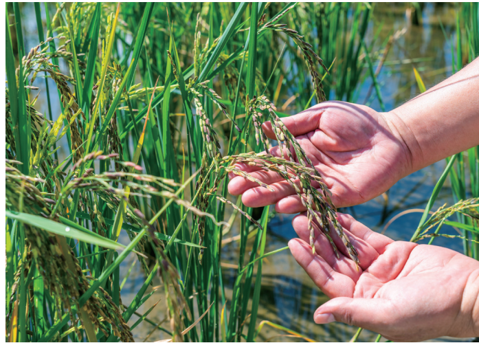
氣候變遷使得黑米結穗不如以往飽滿，若剝開稻殼查看，會發現空包彈的比例較以往高。

害蟲福壽螺則用苦茶粕防治，或在整地排水後將牠們從田間水窪撈除。此外，為了增加土壤有機物質含量，他每種稻3年就會輪作一年的蔬菜。近一年受全台缺水影響，他第一次看到田地龜裂，擔憂米粒結不起來會變成空包彈，還挖了一口井來因應。