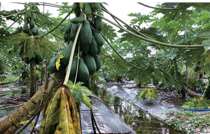
(左) 受去年上半年的乾旱及8月連續豪大雨影響，中南部的木瓜產地損失慘重。