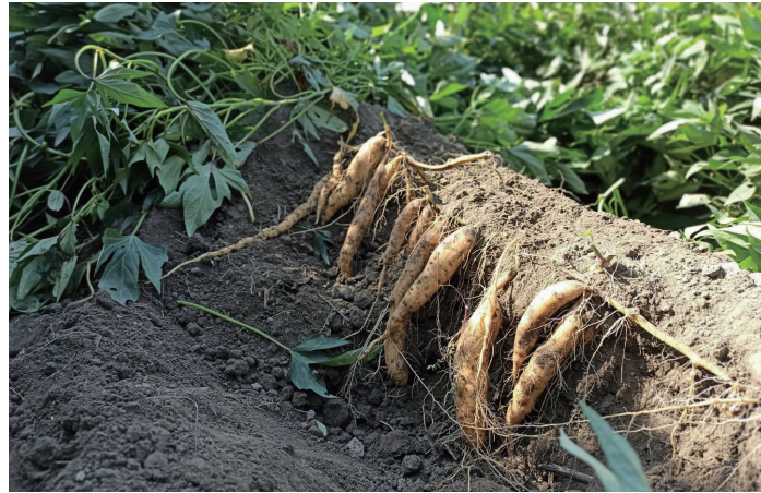
雨量的失常影響土壤酸鹼性，使得地瓜容易感染真菌及病害，難以健康成長。

慶堂對此深有體會。為了創造好口感，他栽種的台農57號有機地瓜，都選擇於每年秋分節氣之後才種下；亦在田區四周種植灌木植物春不老，便於鳥類與昆蟲棲息繁衍。只是，即便他懂得擇時而種，也創造了具備生物多樣性的田區，依舊難敵大環境變異。