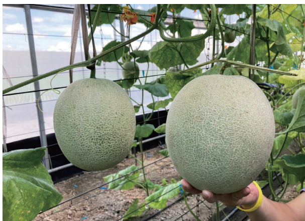
(右) 在連續降雨攪局下，讓網紋洋香瓜難以在開花期授粉及吸收陽光，影響收成。

然而，2021年上半年，中南部地區先是經歷乾旱，至少兩個月沒下一滴雨，接著夏季卻遭逢連續大雨。好不容易在乾旱中存活的瓜果，正進入成熟結果的關鍵時期，大水一淹，幾乎全軍覆沒。