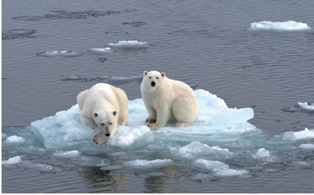
地球暖化導致冰山溶解、海平面上升，讓北極熊覓食困難、面臨滅絕危機。

勢；氣溫也影響季節分布，21世紀初夏季天數增加到120至150天，冬季已縮短到約70天，近來，冬季更縮減到20～40天。又如降雨，少雨年的發生次數明顯增加；而在1990至2015年間，年最大一日暴雨強度也明顯增加。