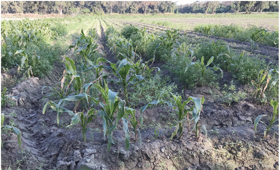
極端氣候型態如乾旱、強降雨等影響玉米生長，再加上蟲害的肆虐，讓玉米面臨全軍覆沒的危機。

喜 歡吃果乾的你，應該有發覺里仁架上的芭樂乾或芒果乾已缺貨多時，而冰箱裡冷凍有機玉米粒也消失了蹤影。身居都市，即使感受不到氣候的強烈變化，卻對喜愛的食品買不到或吃不著很有感覺吧！