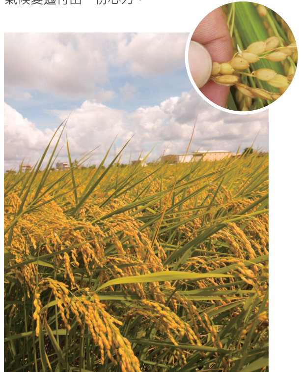
稻米垂穗是豐收的象徵。收成前如遇連續下雨一周以上，就有機會發生穗上發芽的狀況，影響稻米品質與產量。(右上小圖)

氣候變遷不可逆，當稻作休耕成為常態、稻米產量愈來愈不穩定的趨勢下，台灣糧食自給率的提升不應只是政策或口號，更是全民的重責大任。消費者多吃米食，支持台灣有機米糧，就能撐起農友照顧土地永續的用心，也為減緩氣候變遷付出一份心力。