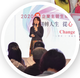
企業主管 生命成長營