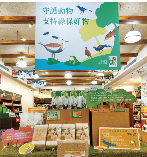
消費者因為支持里仁，共同投入了愛護環境的志業。

實際上卻充滿各種限制，消費者必須不斷地自行登錄。一銀的優惠資訊則是登記一次就能使用一整年。