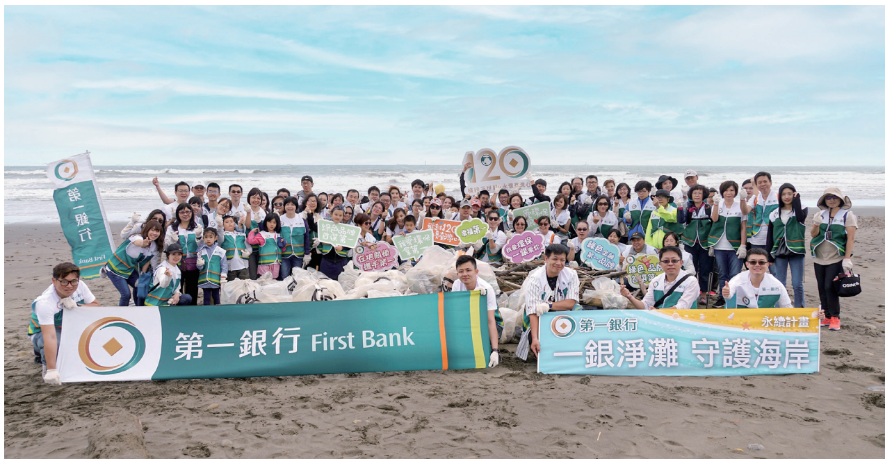
第一銀行多年來積極推動綠色投資、綠色消費及環保公益等各項活動，並期許成為「綠色金融，第一品牌」。

念，到門市人員的推廣說法，都不鼓勵過度消費，而是強調讓日常的消費展現公益價值。消費者手上動輒數張信用卡，願意申辦一張有公益理念的卡，自然不是錦上添花，而是個人善意驅動或環保意識下的行動。