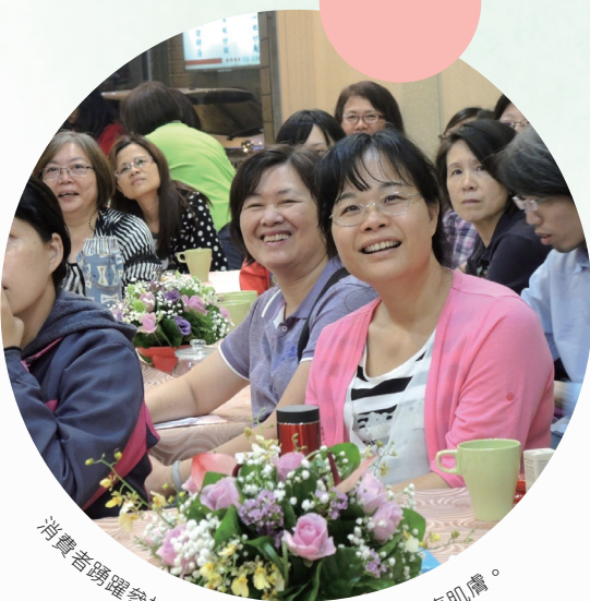
消費者踴躍參加保養品講座，了解什麼是健康肌膚。